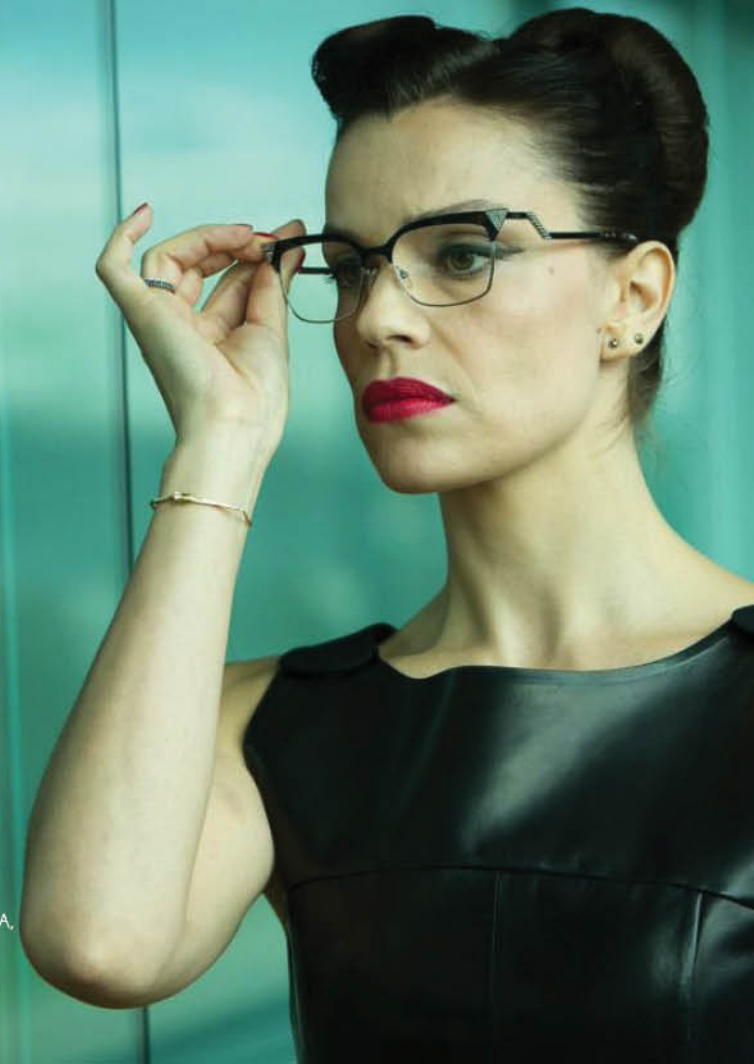
MICAELA RAMAZZOTTI INTERPRETE DI HO UCCISO NAPOLEONE , L'ULTIMO FILM DI GIORGIA FARINA, NEI CINEMA DAL 26 MARZO